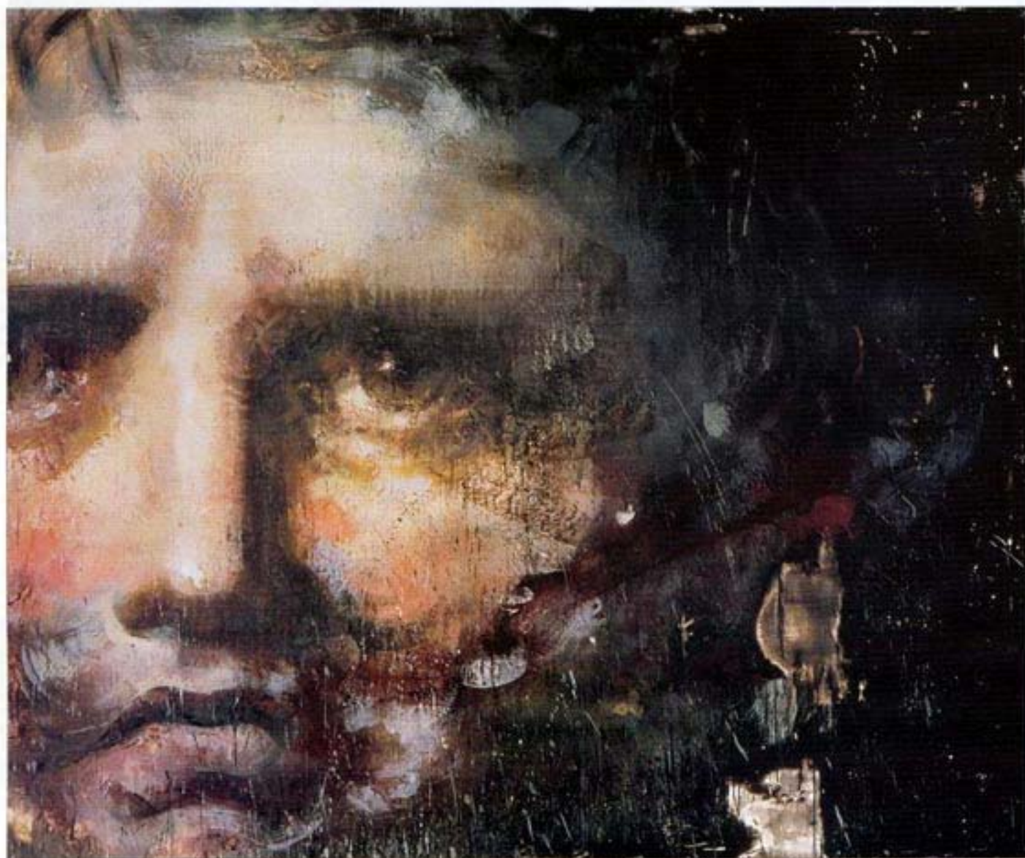
«Bonaparte Dreaming of Napoleon», 1996-99. Cire et pigments / toile, 213 x 244 cm. Wax + pigments/carvax