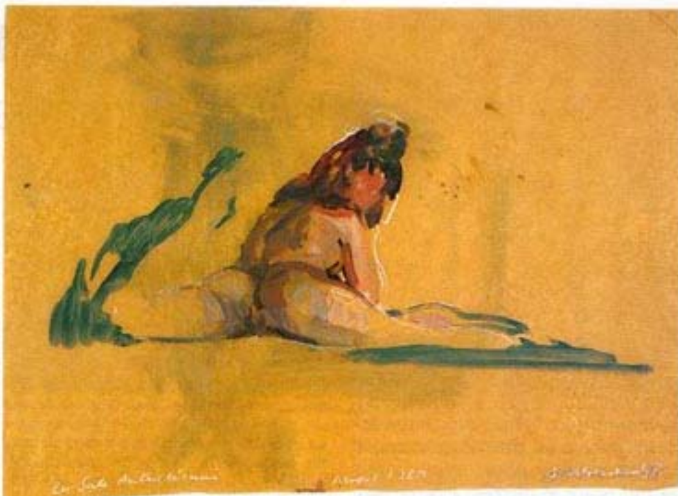
«About 1789 - La sale Aurichienne». 1998. Encaustique, crayon, cire : 85 x 91 cm. "The Dirty Austrian." Encaustic, crayon, brown wax

I read a lot of books about the French Revolution before starting on this work, in order to understand what must have happened in human terms during those years that were decisive for French history and beyond. In an interview at the end of the book