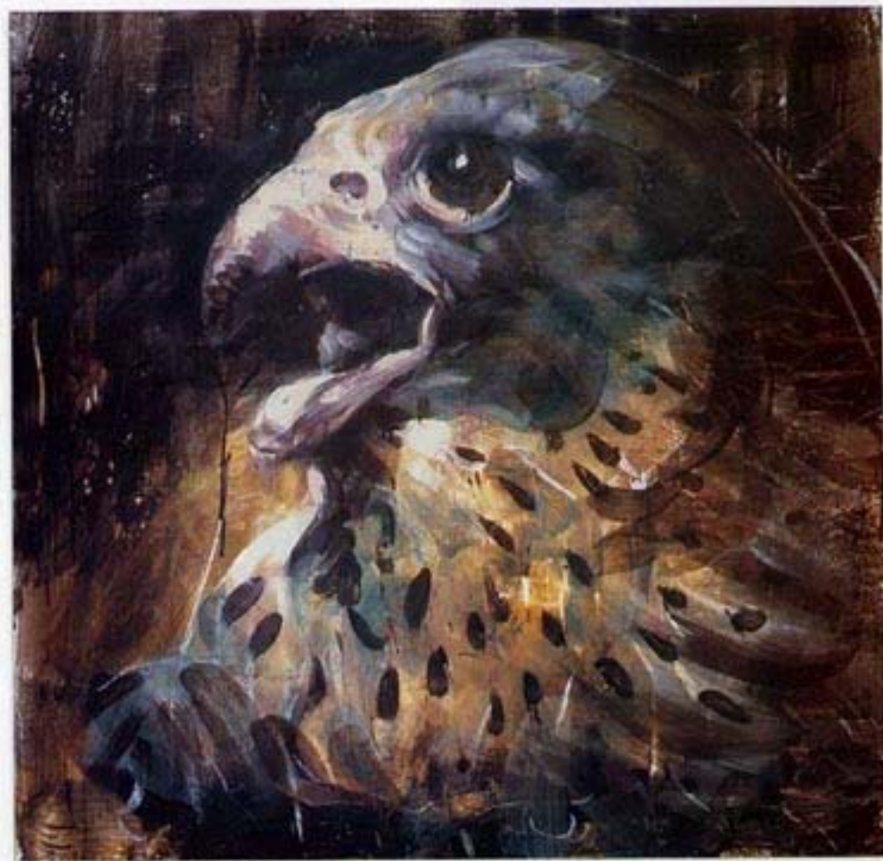
«Marat», 1997. Cire et pigments / toile, 102 x 102 cm. (Col. privée). Wax + pigments/canvas.

At school our grandparents learnt Greek and Roman mythology. Our parents less so, ourselves even less. The very little I know I picked up from the movies. I saw Hercules ,