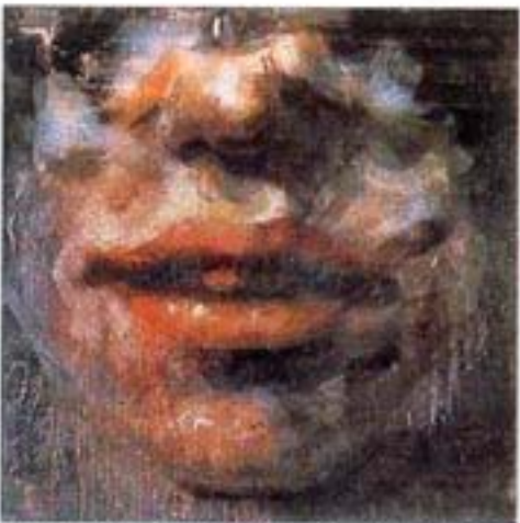
«Liberty 1789: Gillian Anderson», 1996-97. Peinture à la cire / toile. 183 x 183 cm. Wax painting on canvas