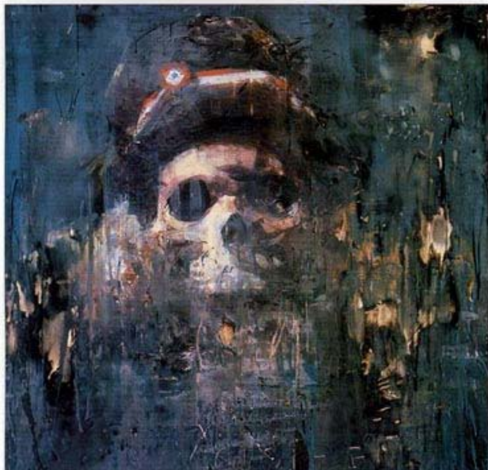
«La liberté 1795», 1995-97. Cire et pigments / toile, 102 x 102 cm, "Freedom: 1/95." Wax and pigments/canvas

2000/2001 Exposition itinérante dans divers musées aux USA (accompagnée du livre Chasing Napoleon , textes de Hans Belting, David Moos et Jacques Hérich).