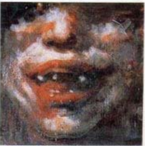
«Liberty 1700: Gillian Anderson», 1996-97. Peinture à la cire / toile. 183 x 183 cm. Wax painting on canvas