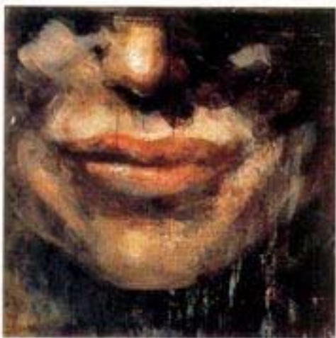
«Liberty 1776: Gillian Anderson», 1996-97. Peinture à la cire / toile. 183 x 183 cm. Wax painting on canvas